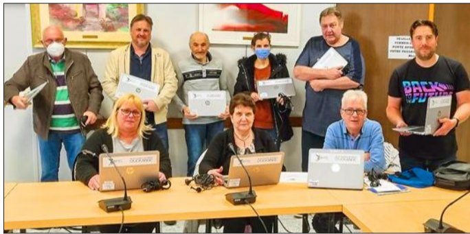
Les ordinateurs alloués faciliteront la gestion des clubs.

L'Office municipal des Sports a réuni les clubs sportifs en mairie pour faire le point sur la programmation des événements prévus à Uckange dans les semaines et les mois à venir.