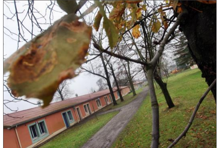
La Ville va devoir engager des travaux rapidement dans certaines salles qui ne répondent pas aux normes de sécurité incendie.

En redéfinissant le règlement de Bétange, Rémy Dick entend mettre un terme aux « mauvaises pratiques ». Dans le viseur, « les associa-